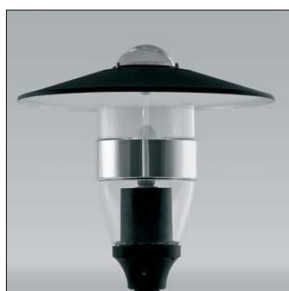
Oprawa OPC-1 klosz Auris z daszkiem malowanym