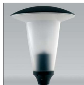
Oprawa OPC-1 klosz Atlantis mrożony z daszkiem malowanym

Oprawa OPC-1 Ø60, Ø76 – do kloszy z kolnierzem Ø150